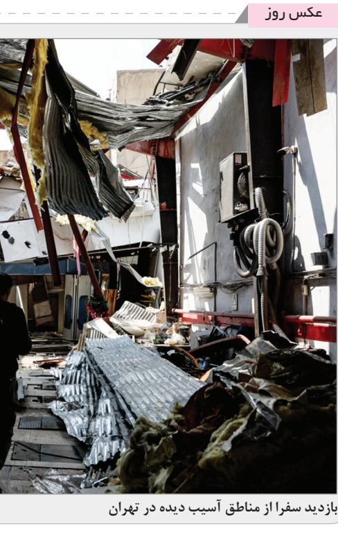
بازدید سفرا از مناطق آسیب دیده در تهران

اگرچه معافیت مالیاتی مناطق آزاد به نوعی مشوق برای سرمایه‌گذاری خارجی و داخلی بوده و همچنین تسهیل تولید و صادرات را به همراه دارد اما بنابر نظر کارشناسان، در سال‌های اخیر به درستی اجرا نشده و اعمال مالیات بر ارزش افزوده در این مناطق و به تبع آن افزایش هزینه‌ها، قدرت و فرصت رقابت را از فعالان اقتصادی گرفته و آنها را با چالش‌های بسیاری مواجه کرده است.