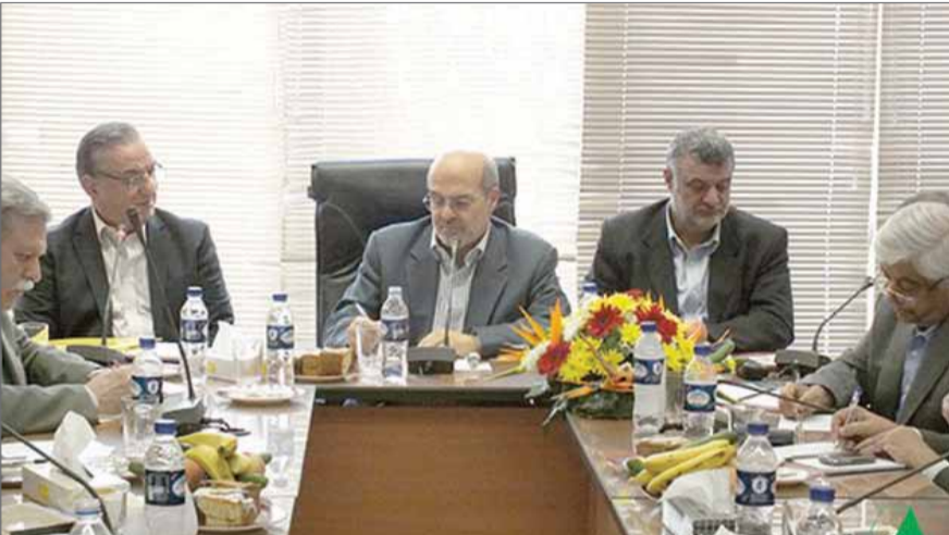
دبیرکل خانه کشاورز: