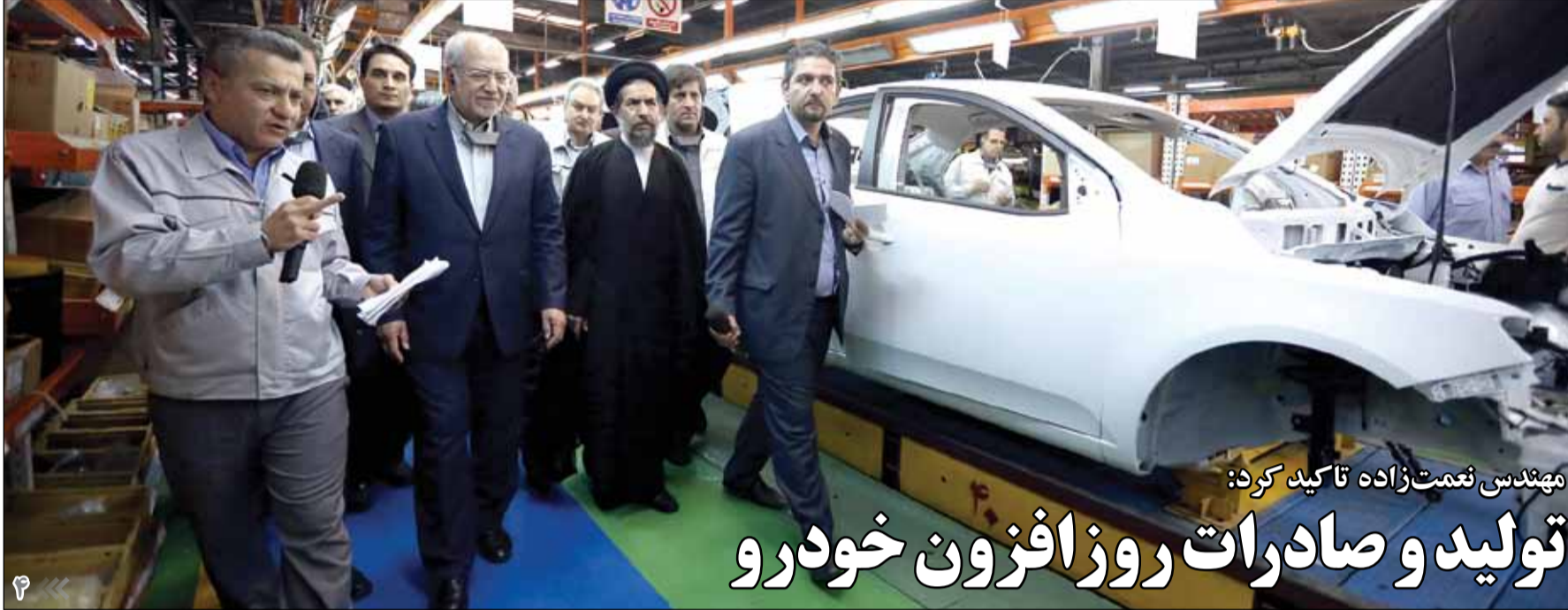
مهندس نعمت‌زاده تاکید کرد: