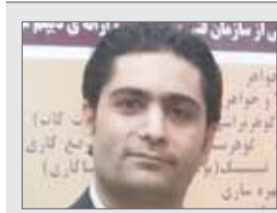
در واقع آنچه سنگ‌های قیمتی و نیمه‌قیمتی را تا چندین برابر ارزشمندتر می‌کند، بحث فراوری و تراش این سنگ‌هاست.

ظرفیت اقتصادی بسیار بالایی در زمینه سنگ‌های قیمتی و نیمه‌قیمتی در دنیا وجود دارد، اما کشورهای انگشت‌شماری در دنیا وارد این صنعت - هنر شدند. درحال حاضر کشور ما ایران صاحب معادن بسیار خوبی در زمینه سنگ‌های قیمتی و گاهی نیمه قیمتی است. البته کشورهایی همچون افغانستان و تاجیکستان و کشورهای همجوار نیز دارای معادن غنی چون زمرد، لعل، بدخشان و لاجورد هستند. اما یکی از غنی‌ترین معادن دنیا همراه با تنوع بالا در زمینه سنگ‌های قیمتی