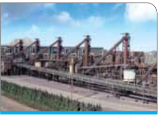
جدید را نداشت.

دقیق، کمپرسورها، اسکرابرها، تعمیرات نوساز کوره، لاین باستل، تاپ گس، نطفات اسکرابرها و... از جمله فعالیت های انجام شده در این مدول بود. رئیس تعمیرات احیا مستقیم تبریز گفت: در بهمن سال گذشته و با استفاده از فرصت تولید با توجه به محدودیت های اعمال شده در تأمین گاز و برق، شات دان سالانه مدول D نیز برنامه ریزی و سپس با فراهم کردن زیرساخت های لازم و با مساعدت دیگر واحدهای پشتیبانی و همکاری شرکت ایرسا و فراهم شدن شرایط ایمن، تعویض و ارتقای سیستم کنترل مدول D نیز با موفقیت انجام شد.