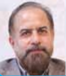
کومرث کرمانشاهی کارشناس اقتصاد

عملکرد بخش صنعت و معدن را در طول یک دهه گذشته از منظرهای متفاوتی می‌توان مورد نقد و بررسی قرار داد. اما با نگاهی کلی می‌توانیم دریابیم که ظرف یک دهه گذشته شاهد سایه افکندن چالش‌های مختلف اقتصادی در کشور بوده‌ایم. بخش مهمی از این چالش‌ها در نتیجه تصمیمات و سیاست‌گذاری‌های اشتباه مسئولان حاصل شده است.