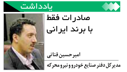
مدیرکل دفتر صنایع خودرو و نیرو محرکه

در حال حاضر یکی از مباحث اصلی صنعت خودرو در کنار تولید محصولات، مقوله صادرات خودرو به بازارهای جهانی است، اما آنچه می‌تواند یک خودرو ساز یا یک برند را در این خصوص با اقبال مواجه کند، کیفیت محصولات در کنار تنوع و قیمت پایین آن است. با توجه به تفاوت ساختار تولید در ایران و اینکه فضای تولید بعد از فضای سیاسی کشور شکلی مثبت به خود گرفته است، می‌توان امیدوار بود با توجه به اهداف سند چشم‌انداز خودرو و پیش‌بینی سالانه ۱ میلیون دستگاه خودرو، بازارهای صادراتی ایران از همسایگان به دور دست گسترده‌تر شود.