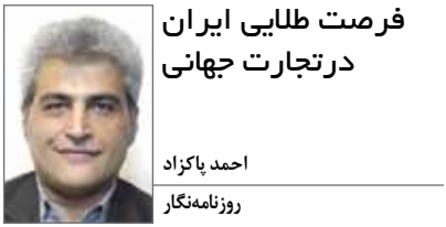
فرصت طلایی ایران در تجارت جهانی