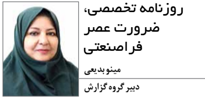
روزنامه تخصصی، ضرورت عصر فرامنعتی مینوبدی دبیر گروه گزارش

مانوئل کاستلر استاد ارتباطات، عصر فعلی را از نظر ارتباطی، جامعه شبکه‌ای نام می‌برد. در جامعه شبکه‌ای ارتباطات به شکل مجازی و از طریق ابزارهای الکترونیکی است و در چنین جامعه‌ای، ابزارهای اصلی و بنیادی ارتباطات، شبکه‌های جهانی، فراملیتی و ملی اجتماعی است. در این جامعه، مرزهای ملی در نوردیده شده است و همه افراد در تمامی نقاط دنیا با به‌کارگیری وسایل و ابزارهای الکترونیکی مدرن و پست مدرن ارتباطات در تعامل و تبادل اطلاعات، آگاهی‌ها، اخبار و رویدادها و... هستند.