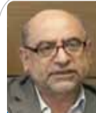
مر تفسی الله‌داد اقتصاددان

در محافل اقتصادی مدت‌هاست که سخن از حذف ۴ صفر از پول ملی در میان است تا شاید این راهکار بتواند جلوی افزایش تورم و انتظارات تورمی را بگیرد. زمان کنونی بهترین فرصت دولت برای انجام این جراحی بزرگ است. مالیات، اصلاح نظام بانکی، حذف یارانه نقدی، اصلاح نرخ سوخت و انرژی، اصلاح نظام گمرکی، اصلاح نظام ارزی، خصوصی‌سازی و... از مواردی است که دولت به‌جهد به دنبال اجرای آنهاست، اما به‌نظر می‌رسد مادامی که برای کنترل نقدینگی کشور فکر و از ریشه این معضل ویرانگر مرتفع نشود، حجم بالای نقدینگی همچون آفتی ویرانگر ریشه‌های اصلاحات اقتصادی را سست خواهد کرد. تورم، نقدینگی و نرخ ارز زنجیروار به‌هم پیوسته‌اند و اگر تورم و نقدینگی کنترل نشوند، نرخ ارز و کالاها کنترل نمی‌شود؛ بنابراین برای درمان دردهای اقتصاد باید این سه عامل موثر همیشه به‌شکل یک بسته دیده شوند.