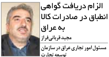
مسئول امور تجاری عراق در سازمان توسعه تجارت

الزام دریافت گواهی انطباق در صادرات کالا به عراق مجدد قربانی فراز از اواسط خرداد امسال به دنبال نا آرامی و بی‌ثباتی در عراق، محصولات ایرانی بدون دریافت گواهی انطباق شرکت‌های بازرسی عراقی و تنها با دریافت گواهی وزارت بهداشت ایران به این کشور صادر می‌شد اما از اوایل آذرماه دریافت گواهی انطباق کالا (COC) الزامی شده است و صادرکنندگان ملزم به رعایت آن هستند. دریافت گواهی انطباق به منظور همسویی با استانداردهای عراق صورت می‌گیرد و با لغو الزام به دریافت گواهی انطباق در خرداد امسال فرصتی طلایی برای صادرکنندگان ایجاد شد تا محصولات خود را راحت‌تر به این کشور صادر کنند اما هم‌اکنون مقامات عراقی تشخیص داده‌اند که دریافت این گواهی به فرآیند صادرات برگردد. این تصمیم به دلیل زمان‌بر بودن ممکن است صادرات ایران را تحت‌الشعاع قرار دهد. امیدواریم صادرکنندگان برای این بخش برنامه‌ریزی لازم را انجام دهند و با اتکا به کیفیت محصولات صادراتی جایگاه خود در بازار عراق را حفظ کنند. ضمن اینکه صادرکنندگان در افزایش صادرات نیز تلاش مضاعفی دارند. از سوی دیگر، سازمان ملی استاندارد باید در جهتی حرکت کند که استانداردهای کشور مورد پذیرش کشورهای مختلف قرار بگیرد. در ۸ ماه امسال صادرات کالا به عراق ۳ میلیارد و ۲۰۰ میلیون دلار بوده، در این مدت صادرات خدمات فنی - مهندسی نیز به ۴۰۰ میلیون دلار رسید. امیدواریم تا پایان سال مجموع صادرات ایران به عراق نسبت به سال گذشته افزایش یابد. مهم‌ترین اقلام صادراتی ما به عراق هم مصالح ساختمانی شامل سیمان، سرامیک و کاشی و مواد غذایی است. همچنین درباره انتقال وجوه ارزی از عراق باید بگوییم بانک پارسیان شعبه بغداد آمادگی خود را برای انتقال وجوه ارزی به نرخ ارز آزاد اعلام کرده است.