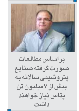
بر اساس مطالعات صورت گرفته صنایع پتروشیمی سالانه به بیش از ۷ میلیون تن پتاس نیاز خواهند داشت

شبنانی به فعالیت بخش خصوصی برای تولید مورد نیاز کشور اشاره کرد و افزود: در حوزه خلیج فارس شاهد فعالیت بخش خصوصی در این زمینه هستیم. از سوی دیگر دریاچه نمک در نزدیکی کاشان و آران