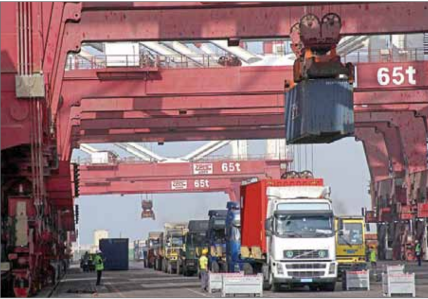
درآمدهای مالیاتی دولت (به استثنای درآمدهای اختصاصی) در ۶ ماه نخست سال‌های ۸۸ تا ۹۳

با توجه به اهمیت این مقوله مدتی پیش بانک مرکزی در گزارش عملکرد مالی و بودجه‌ای دولت در ۶ ماهه نخست سال ۹۳ درآمدهای مالیاتی دولت