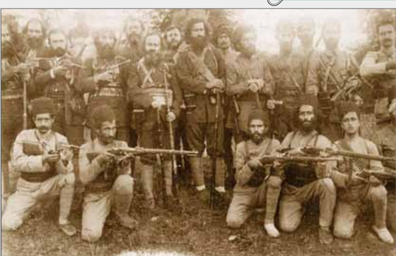
به یاد میرزا کوچک خان جنگلی رهبر قیام جنگل و بارانش