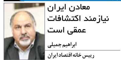
معادن ایران نیازمند اکتشافات عمقی است

با توجه به اینکه سازمان ایمیدرو اکتشافات وسیعی را آغاز کرده و اعلام کرده است پس از آغاز مراحل اکتشافی و رسیدن به ۵۰ درصد قطعیت در مورد میزان ذخیره معدنی آن را به بخش خصوصی واگذار خواهیم کرد، این موضوع می‌تواند گام بزرگی در تسریع فرآیند توسعه بخش معدن باشد زیرا در شرایطی که متعقدیم باید بخش معدن فعال شود سرعت فعالیت‌های اکتشافی و استخراجی نیز باید به همان میزان افزایش یابد. حال بخش خصوصی می‌تواند در کنار دولت به بهبود شرایط معادن کشور کمک کند. به‌طوری که واگذاری محدوده اکتشافی به بخش خصوصی پس از مشخص شدن میزان ذخیره معدنی منجر به این می‌شود که دولت سبک‌تر شود و در کنار برنامه‌های بخش خصوصی برای اکتشاف تکمیلی دولت زیرساخت‌های فرآوری را فراهم کند.