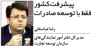
مدیر کل دفتر امور نمایندگی‌های سازمان توسعه تجارت

پیشرفت کشور فقط با توسعه صادرات روز عباسقلی