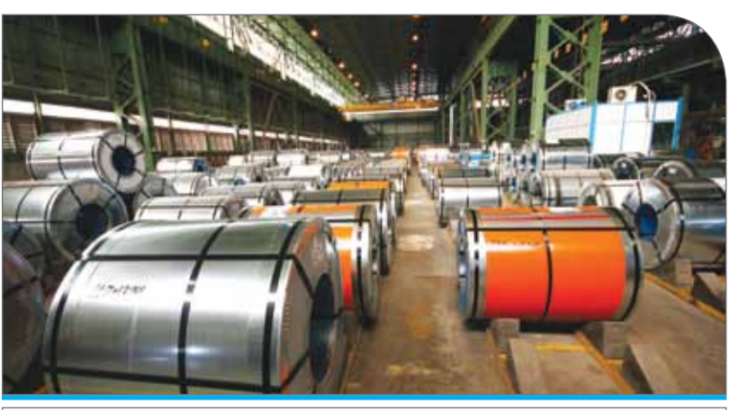
انرژی یکی از مهم‌ترین چالش‌های جدی در کشور بوده و خواهد بود که باید برای بهینه‌سازی مصرف آن فرهنگ‌سازی شود

وی خاطرنشان کرد: مدیران و کارکنان فولاد مبارک، سفیران فرهنگ‌سازی برای مصرف بهینه انرژی هستند و روابط عمومی شرکت فولاد مبارک نیز باید در این زمینه تلاش‌های جدی انجام دهد. البته این کار مربوط به امروز نیست و برای فرهنگ‌سازی باید برای سال‌های متمادی برنامه‌ریزی کرد، اما شروع‌کننده این حرکت باید فولاد مبارک باشد.