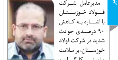
گروه معدن editor@smtnews.ir