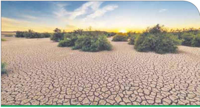
کشورهای توسعه‌یافته ملزم به تامین مالی، انتقال تکنولوژی و ظرفیت‌سازی برای کشورهای در حال توسعه هستند؛ به این ۳ اقدام کشورهای توسعه‌یافته، ابزارهای اجرایی گفته می‌شود

براساس توافقنامه پاریس، کشورهای ثروتمند موظف هستند سالانه میزان مشخصی کمک نقدی برای کاهش انتشار گازهای گلخانه‌ای و سازگاری کشورهای در حال توسعه بپردازند اما کشورهای در حال توسعه در نشست جهانی تغییرات اقلیمی در شهر بن آلمان، کشورهای ثروتمند را متهم به عدم پایبندی به تعهدات خود در قبال پرداخت پول نقد برای جبران خسارت کرده‌اند. اعتراض کشورهای فقیر تر بر این اساس است که در اجلاس تغییر اقلیم سال گذشته در گلاسکو به آنها قول داده شد امسال به خواسته‌های اصلی آنها توجه شود و با اختصاص بودجه‌ای جدید به آنها کمک شود تا با خسارت‌های ناشی از افزایش دما مقابله کنند اما این موضوع در کنفرانس بن به حاشیه رفته است.