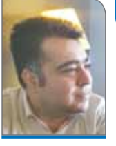
با کاهش نیرو در کارگاه‌ها و واحدهای صنعتی روبه‌رو خواهیم بود.

این عضو انجمن صنعت چرم ادامه داد: تولیدکننده اگر نتواند هزینه‌های سربرابر را در تیراژ پوشش دهد، زیان خواهد کرد. باید توجه داشت هزینه‌های سربرابر چیزی نیست که به این سادگی بتوان از آن رد شد. امیدواریم دولت با سیاست‌گذاری‌هایی که دارد، وضعیت را بدتر از قبل نکند.