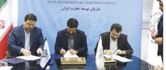
سازمان توسعه تجارت ایران