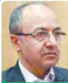
علی فاضلی رئیس پیشین اتاق اصناف ایران