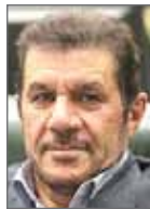
کاهش قیمت با کاهش هزینه‌های تولید سید عنایت‌الله هاشمی عضو کمیسیون صنایع مجلس

در حال حاضر کارشناسان معتقدند که برای تقویت و ترغیب خودروسازان به بالا بردن کیفیت محصولات آنها کاهش تعرفه واردات خودرو نمی‌تواند چاره‌ساز باشد اما از سوی دیگر باید توجه داشت که در این شرایط خودروسازان دیگر قادر به ادامه حیات نیستند. از سوی دیگر کاهش قیمت خودرو در شرایط فعلی امری غیرممکن و نشدنی به نظر می‌رسد. همچنین در این شرایط ۲ شرکت بزرگ خودروساز یعنی ایران خودرو و سایپا با توجه به سازوکارهای اداری و روند مدیریت و نحوه قیمت‌گذاری و هزینه‌های سربار قادر به کاهش قیمت محصولات خود نیستند زیرا اگر این ۲ شرکت مجبور به کاهش قیمت محصولات خود باشند به طور قطع از ادامه حیات باز می‌مانند و قادر به ادامه تولید نیستند. این در حالی است که سایر شرکت‌های خودروساز در کشور به دلیل اینکه بیشتر مونتاژ در تولید دارند از برخی از قواعد و هزینه‌های اضافی به دور هستند و کاهش قیمت ضرر و زبانی به مجموعه کاری آنها وارد نمی‌کند.