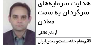
هدایت سرمایه‌های سرگردان به سمت معادن