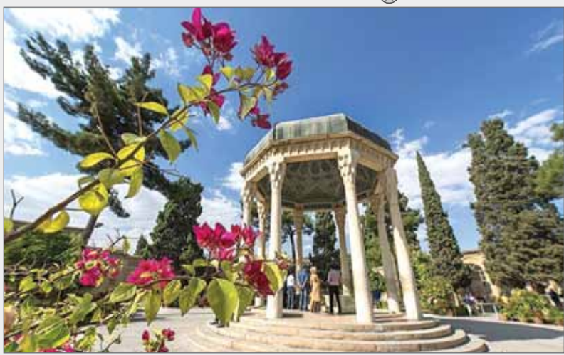
آرامگاه حافظ - شیراز