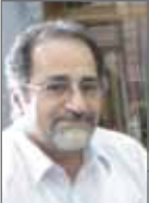
فریدون وردی‌نژاد سفیر سابق ایران در چین

شکوفایی اقتصادی چین در شرابطی اتفاق افتاد که به دلیل شیوه کمونیستی رابطه خوبی با دنیا نداشت. اما بعد از فروپاشی شوروی این کشور و اقتصادش توانستند در عرصه اقتصاد و به طور مشخص تجارت خودنمایی کنند. چین دارای فاکتورهایی بود که از طریق آنها توانست اهدافش را در اقتصاد عملی کند. اولین نکته جمعیت میلیاردی بود که به چین کمک می‌کرد تا بتواند از نیروی پرشمار و ارزان در چرخه فعالیت‌هایش استفاده ببرد. همچنین ثبات سیاسی در این کشور و همچنین تغییرات در نوع حکومت باعث شد تا مقوله اقتصاد با سیاست جدا شود و دقیقاً به همین دلیل بود که آنها توانستند در فعالیت‌های اقتصادی توفیق داشته باشند و در نتیجه حضوری پررنگ و مثبت در تجارت جهانی داشته باشند. حالا چین با پشت‌سر گذاشتن دوران گذار، وضعیت اقتصادی‌اش را در شرابطی می‌بیند که می‌تواند ادعا کند قدرت برتر اقتصاد و تجارت دنیا در هزاره سوم است.