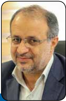
اقدامات ایمنی و احیای بخش اکتشاف و احیای معدن کوچک مقیاس