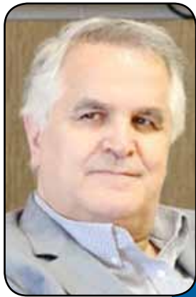
ایمیدرو مسئول ۴۰ تا ۵۰ درصد ثبات ارزی کشور