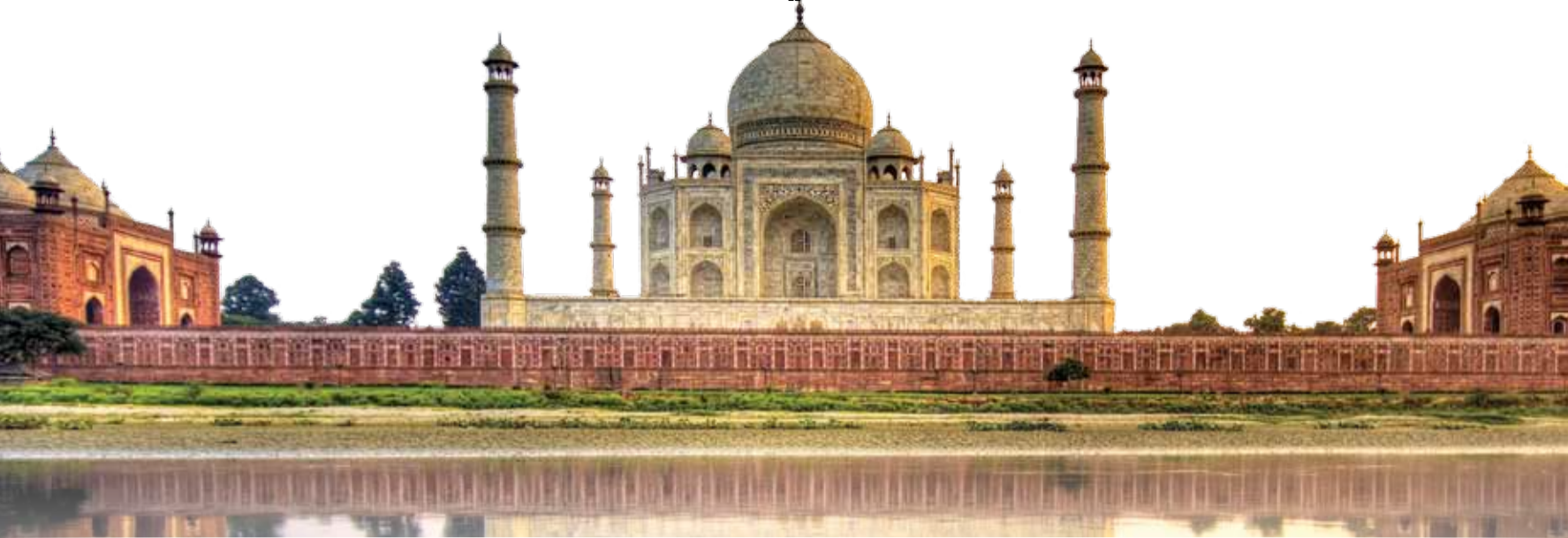
صنعت نمایشگاهی هند را بررسی می‌کند

در پایان می‌توان گفت که سودان بازاری مناسب برای معرفی گروه کالایی ماشین‌آلات، تجهیزات و مصالح ساختمانی، تجهیزات برق و نیروگاهی، آب و فاضلاب؛ خدمات فنی و مهندسی خطوط تولید مستعمل، صنایع خودروسازی، لاستیک و پلاستیک، ماشین‌آلات کشاورزی، صنایع غذایی و نوشیدنی‌ها، لوازم خانگی، دارو و آرایشی بهداشتی، سرمایه‌گذاری و... است که در صورت توجه فعالان اقتصادی ایران به این بازار ارزشمند، می‌تواند عاملی برای رشد و توسعه صنایع مختلف ما نیز باشد.