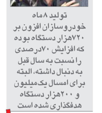
تولید ۸ ماه ۷۲۰ هزار دستگاه بوده که افزایش ۷۰ درصدی را نسبت به سال قبل به دنبال داشته، البته برای امسال یک میلیون و ۲۰۰ هزار دستگاه هدفگذاری شده است

معاون وزیر صنعت، معدن و تجارت گفت: با توجه به اینکه تحریم خودرو چند ماه قبل برداشته شد اما مباحث مرتبط با مرادات بانکی همچنان پابرجاست که این مانعی برای حضور خودرو سازان خارجی به شمار می‌آید