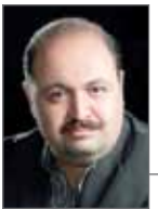
شهرام شیر کوند