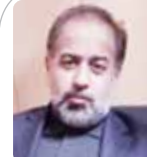
کیومرث فتح‌الله کرمانشاهی، معاون کل اسبق سازمان توسعه تجارت