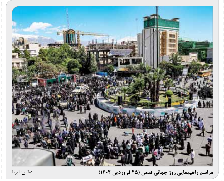
مراسم راهپیمایی روز جهانی قدس (۲۵ فروردین ۱۴۰۲)

سخنگوی وزارت صمت گفت: از امروز مبلغ ۱۰۰ میلیون تومان که متقاضیان برای ثبت‌نام در حساب خود (به‌نام سازمان حمایت) مسدود کرده‌اند با حفظ نوبت تحویل خودرو آزاد می‌شود. به گزارش مهر امید قالیباف، سخنگوی وزارت صمت، اظهار کرد: نوبت‌دهی متقاضیان خرید خودرو از شرکت‌های سایپا، مدیران خودرو، فردا و ایلیا انجام شده و تمامی این متقاضیان حداکثر ظرف ۳ ماه خودرو خود را دریافت خواهند کرد. وی افزود: متقاضیان خودروهای شرکت‌های کرمان‌موتور و مکت‌موتور نیز حداکثر در مدت ۶ ماه می‌توانند خودرو خود را تحویل بگیرند. سخنگوی وزارت صمت با اشاره به اینکه نوبت‌دهی متقاضیان خودرو از شرکت‌های ایران خودرو، بهمن خودرو و آری‌ن خودرو نیز انجام شده، گفت: درباره این ۳ شرکت باید برنامه تولید با لیست متقاضیان تطبیق داده شود که این کار در حال انجام است و حداکثر تا آخر این هفته مشتریان این شرکت‌ها می‌توانند با مراجعه به حساب