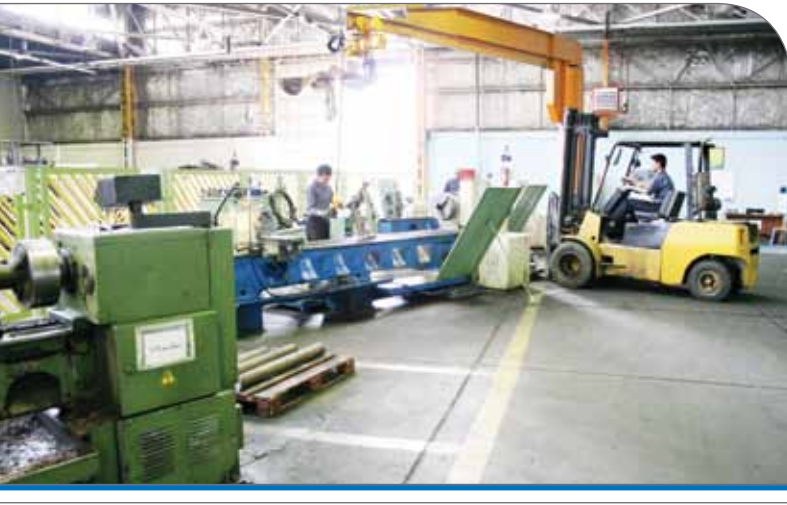
حمایت از تولید یعنی هوای بخش تولید کشور را بیشتر داشته باشیم و چالش‌های آن را اگر برطرف نمی‌کنیم، زیاد هم نکنیم

چند سالی می‌شود که بخش صنعت در تابستان درگیر قطعی برق است و در زمستان نیز با کمبود گاز دست‌وپنجه نرم می‌کند، این در حالی است که این‌گونه کمبودها، موجب کاهش تولید و به تبع آن، کاهش عرضه خواهد شد و در نهایت، افزایش نرخ کالا را به‌دنبال خواهد داشت. حال آنکه بیشترین دلیل این مشکلات را به اجرایی نشدن برنامه‌های کلان و ایجاد زیرساخت‌های مربوط می‌دانند اهدافی که باید دنبال می‌شد و متأسفانه در چرخه ناکارآمدی‌های مسئولیتی به مشکلات بزرگ تبدیل شده است. با این حال باید ادامه داد و در سالی که به‌نام تولید آغاز شده با راهکارهایی کوتاه‌مدت هوای تولید را داشت تا در بلندمدت کشور بتواند عقب‌ماندگی خود را در ایجاد نیروگاه‌ها زیرساخت‌های تامین برق جبران کند. اینکه از مهم‌ترین نیاز جامعه‌مان غفلت کرده‌ایم، یعنی مسیر را اشتباه رفته‌ایم، اما به‌هر حال تا قرار گرفتن در ریل درست می‌توان با اقدامات حمایتی، آسیب‌ها به تولید را کم کرد. صنعت در این گزارش، نظرات فعالان حوزه صنعت را در این باره که در زمان قطعی برق با چه چالش‌های مواجهند و برای دولت چگونه می‌تواند این مشکل را در کوتاه‌ترین زمان ممکن برطرف کند، جویا شده است. با صنعت همراه باشید.