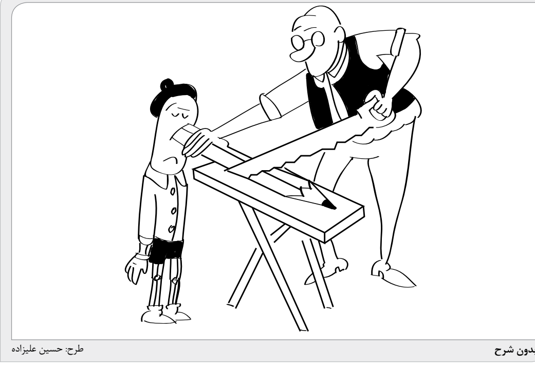
طرح: حسین علیزاده

عضو کمیسیون انرژی اتاق بازرگانی با بیان اینکه مطابق دستورالعمل تامین برق بخش خانگی خط قرمز است گفت: تلاش می‌شود برق واحدهای مسکونی قطع نشود، مصرف برق بخش خانگی نهایتا ۴۵ درصد است. بنابراین اگر در تابستان با تنگنای تامین برق نیز مواجه شویم و قرار بر اعمال قطعی برق باشد؛ تنها برق بخش صنعتی قطعی و با محدودیت مصرف خواهد داشت. وی ادامه داد: ضرری که کمبود و ناترازی برق به کشور تحمیل می‌کند، اقتصادی است. در این پروسه تولید با کاهش مواجه شده و به شرکت‌های بورسی نیز لطمه