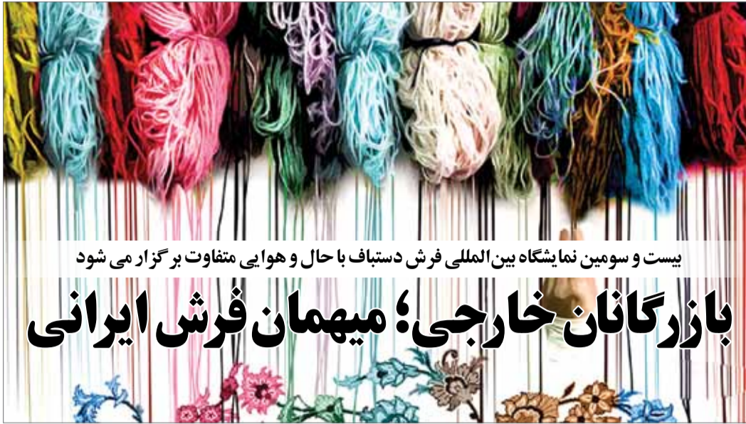
بیست و سومین نمایشگاه بین‌المللی فرش دستباف با حال و هوایی متفاوت برگزار می‌شود

یکی دیگر از اتفاقات ویژه در نمایشگاه امسال فرش دستباف، پخش سری برنامه‌های «پردیس پارسی» است. مرکز ملی فرش ایران در حال تولید سلسله برنامه‌هایی با موضوع فرش دستباف ایران با عنوان «پردیس پارسی» است که نخستین برنامه از این مجموعه، چهارشنبه ۲۹ مرداد و در آستانه برگزاری بیست‌وسومین نمایشگاه فرش دستباف ایران به روی آنتن شبکه ۱ می‌رود. شایان ذکر است در زمان برگزاری نمایشگاه بیست‌وسوم نیز این برنامه شامگاهی در ساعت ۲۰ از شبکه ۱ سیما پخش خواهد شد. گفتنی است پس از ایام برگزاری بیست‌وسومین نمایشگاه فرش دستباف، مجموعه برنامه پردیس پارسی هر هفته بر روی آنتن شبکه ۱ خواهد رفت.