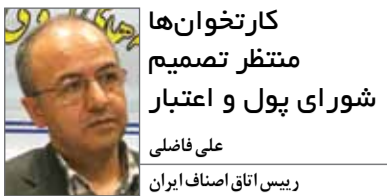
کارخانها منتظر تصمیم شورای پول و اعتبار