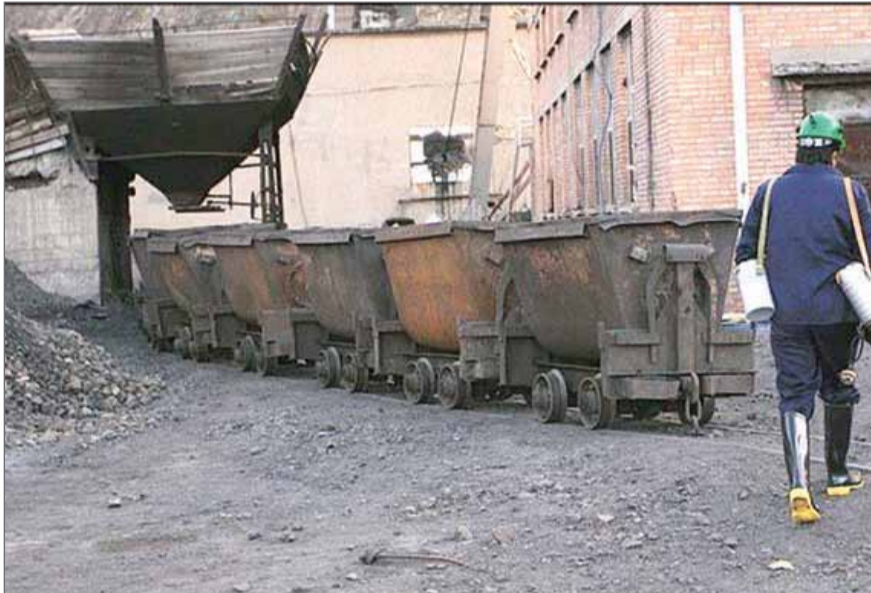
خصوصی نیاز به نظارت دارند.