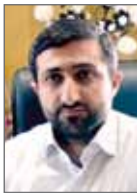
سید حامد عاملی کلغورانی رئیس سازمان صنعت، معدن و تجارت

صادرات استان اردبیل از نظر کالا و بازارهای صادراتی دارای دو اشکال عمده است زیرا تنوع محصول کم بوده و بازارهای صادراتی کم است که این امر یک آسیب جدی برای تجارت خارجی استان به‌شمار می‌رود، به طوری که صادرات استان محدود به مصنوعات پلاستیکی و سیب‌زمینی بوده و در واقع تک محصولی است. ضمن آنکه تنها بازار هدف برای تاجران استان، کشور آذربایجان است. بنابراین تجارت خارجی استان بسیار آسیب‌پذیر است چرا که در مواقع مختلف زمانی تحت تاثیر شرایط محیطی قرار گرفته و به دلایل مختلف از جمله کیفیت پایین، تولید کمتر و... برای تاجران رضایت‌بخش نبوده و بسیاری پر مخاطره است و قابلیت های استان در تجارت خارجی مغفول است. این عوامل ما را بر آن داشت تا به بررسی بازارهای صادراتی جدید و ایجاد تنوع کالایی مشتری پسند در راستای توسعه تجارت استان، اشتغالزایی، ارزآوری و خروج از صادرات تک محصولی بپردازیم و مجموعه این مطالعات در کتابی با عنوان بسترها و فرصت‌های صادراتی استان اردبیل به منظور بهره‌مندی تاجران استان گردآوری است و در اختیارشان قرار گرفت. گرجستان، ارمنستان، یمن، عراق، قطر، اردن، روسیه، جمهوری آذربایجان، کویت، قزاقستان، ترکمنستان، پاکستان، تاجیکستان، مصر و ترکیه از جمله بازارهای جدید صادراتی است که بررسی‌های لازم برای توسعه صادرات استان در آنها انجام و اطلاع‌رسانی شده است. خوشبختانه آمارهای صادراتی استان اردبیل در ۷ ماه گذشته گواهی این امر است که به تدریج تنوع کالایی در تجارت خارجی ایجاد شده است و تا حدودی در این بخش موفق عمل کرده‌ایم اما بازارهای صادراتی جدید هنوز ایجاد نشده و محدود است که تلاش داریم با توسعه زیرساخت‌های لازم برای رفع آن اقدام کنیم.