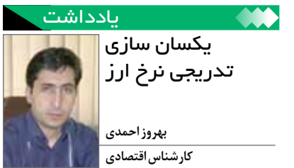
یکسان سازی تدریجی نرخ ارز