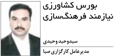
بورس کشاورزی نیازمند فرهنگ‌سازی