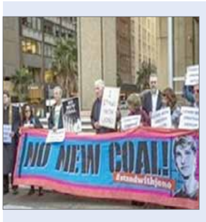
۳. جوانان مولیان استرالیایی یکی دیگر از معترضین با انتشار اطلاعیه جعلی اوراق بورس بهادار ضرری میلیون دلاری به شرکت وایت هون وارد کرده است.

۱. اعتراض رابین لاولی مدل معروف استرالیایی به گونه‌ای بود که توجه جوامع بین‌المللی را به خود جلب کرد. وی با نوشتن شعار «معدنکاری زغال سنگ را متوقف کنید» روی بدنش و انتشار تصویر آن در اینستاگرام اعتراض خود را در راستای مخالفت با فعالیت معدن زغال سنگ کارمایکل نشان داد. البته این اعتراض نتیجه خاصی برای تعطیلی معدن فوق نداشت و تنها موجبات شهرت لاولی را بیش از گذشته فراهم آورد.