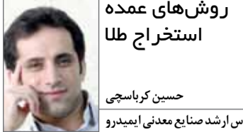
روش‌های عمده استخراج طلا