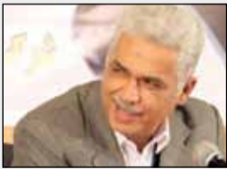
رادئو اقتصاد - رییس هیات مدیره جامعه مدیران و متخصصان صنعت کفش ایران با بیان اینکه سالانه ۱۷۵ تا ۲۰۰ میلیون انواع کفش در کشور تولید می شود، گفت:

محسوب می شوند و بیشترین آمار تولید کفش چرمی کشور مربوط به تبریز است. شهر تبریز با ۳۲۰ واحد تولیدی در حال حاضر ۸۵ درصد از چرم کشور را تولید می کند. لشگری از صدور ۱۳۰ میلیون