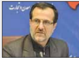
شاتا - مدیرکل دفتر صنایع ماشین سازی و تجهیزات وزارت صنعت، معدن و تجارت از اعلام و انتشار نخستین فهرست کالاها، تجهیزات، لوازم و فرآورده های ساخت واحدهای