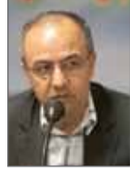
علی فاضلی رئیس اتاق اصناف کشور

اگر تمامی بخش‌ها با برنامه و هدف کار کنند تمامی اهداف مدنظر محقق خواهد شد. امروز باید به مردم و فعالان صنفی گفت که اصناف بیش از هر زمان مورد توجه است و ما باید اصناف را به جایگاه اصلی‌اش بازگردانیم. اکنون براساس برنامه تلاش داریم تا اقدامات را به درستی به اجرا در آوریم. همان‌طور که پیش‌تر در گفت‌وگو با رسانه‌ها اعلام کرده بودم، روند ساماندهی اصناف آغاز شده است و اکنون در مراحل خوبی به سر می‌برد، چرا که به طور علمی روند حرکتی ادامه دارد. برای توسعه اصناف باید با یکدیگر همراه و هماهنگ باشیم. البته نه فقط در خصوص اصناف بلکه در تمامی فعالیت‌های اجرایی کشور و همان‌طور که دولت تلاش دارد گره از مشکلات گذشته باز کند ما نیز باید از تمامی توان خود در راستای کمک در این زمینه استفاده کنیم. بنده معتقدم همکاری تیمی در تمامی بخش‌ها یک اصل در حرکت توسعه اقتصادی محسوب می‌شود و دیگر بخش‌های اقتصادی با اعتماد به دولت باید در این زمینه فعالیت کنند.