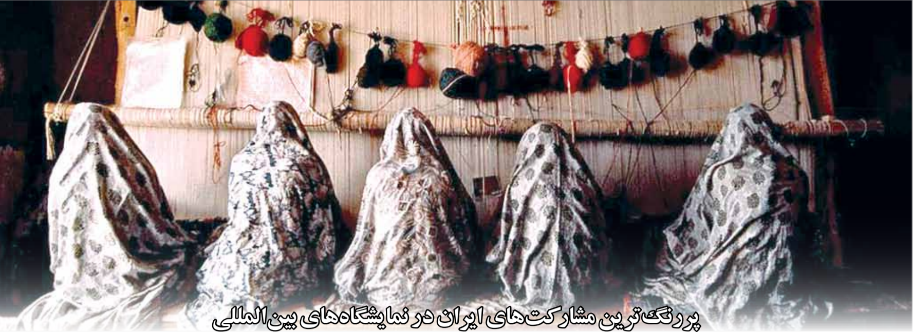
پررونق‌ترین مشارکت‌های ایران در نمایشگاه‌های بین‌المللی

ششمین نمایشگاه تخصصی نفت، گاز، پالایش و پتروشیمی با حضور معاون وزیر نفت در امور مهندسی، استاندار، امام جمعه و دو نفر از نمایندگان بوشهر در مجلس شورای اسلامی و شماری از شرکت‌های دولتی و بخش خصوصی افتتاح و از اول تا چهارم آذر در محل دائمی نمایشگاه‌های بین‌المللی بوشهر برپاست. این نمایشگاه در زمینی به مساحت ۳۰۰۶ مترمربع و ۱۸۰۰ مترمربع سالن اصلی برگزار شده و از ساعت ۹ الی ۱۴ پذیرای عموم بازدیدکنندگان خواهد بود.