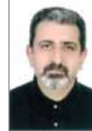
ضرورت پژوهش و تحقیق در توسعه صنعت گچ آرمان عظیمی وزیر کارشناس معدن