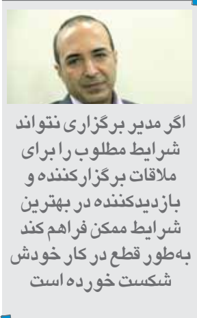
اگر مدیر برگزاری نتواند شرایط مطلوب را برای ملاقات برگزارکننده و بازدیدکننده در بهترین شرایط ممکن فراهم کند به‌طور قطع در کار خودش شکست خورده است

اهداف تجاری و تبلیغاتی برگزارکنندگان را تامین می‌کند؟ بازدیدکنندگانی که به نمایشگاه می‌آیند و نیاز متقابل‌شان قرار است در ملاقات یا مشارکت‌کنندگان تامین شود. حالتی که در این شرایط باید به وجود بیاید تعادل میان مشارکت‌کننده و بازدیدکننده است. یعنی به‌طور مثال اگر من یک نمایشگاه برگزار کنم که از نظر تعداد مشارکت‌کننده بسیار قدرتمند باشد و تمام برندها و نام‌های مهم در آن حضور داشته باشند اما تعداد بازدیدکننده و مخاطبان آن اندک باشد، آن نمایشگاه