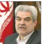
محسن صالحی‌نیا، معاون امور صنایع و اقتصادی وزارت صنعت، معدن و تجارت در گفت‌وگو با

محسن صالحی‌نیا، معاون امور صنایع و اقتصادی وزارت صنعت، معدن و تجارت در گفت‌وگو با صنعت در رابطه با اختصاص ۶۰ درصد از منابع بانکی به بخش تولید گفت: در حال حاضر نیاز بخش تولید ۱۵۰ هزار میلیارد تومان برآورد شده است و تا جایی که اطلاع دارم قرار بود از میزان منابع بانکی که حدود ۲۷۰ هزار میلیارد تومان است، ۶۰ درصد به سرمایه در گردش بخش صنعت و تولید تعلق گیرد که در این صورت تا حدودی نیاز