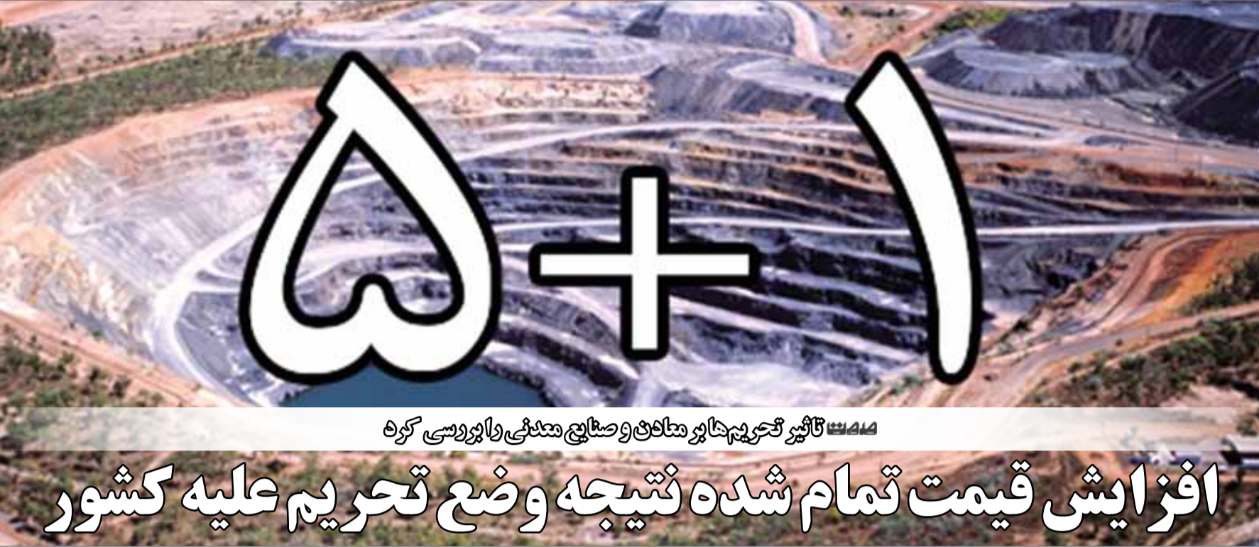
تأثیر تحریم‌های متعلق به صنایع معدنی را بررسی کرد

وی در محل مجلس ضمن دیدار با این هیات معرفی ظرفیت‌های معدنی استان کرمان تصریح کرد: اعضای این هیات در اتاق بازرگانی کرمان نشستی را با نمایندگان اتاق خواهند داشت. عضو کمیسیون برنامه و بودجه مجلس در خاتمه افزود: هیات برزیلی جلسات جداگانه‌ای با معاونت معدنی وزارت صنعت، معدن و تجارت و مدیرعامل شرکت ملی مس خواهند داشت.