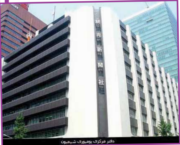
دفتر مرکزی به‌پرتیراژ شیهون

تصاویر این روزنامه در عصر میچی است را روانه بازار کرد. این نخستین باری بود که یک روزنامه قابلیت جست‌وجوی دیجیتالی تصاویر و مقاله‌های خبری خود را آن گونه که در نسخه‌های چاپی‌اش منتشر شده‌اند، تولید کرد. پس از آن، این روزنامه سی‌دی‌های مختلفی مربوط به دوره‌های مختلف انتشار خود تولید و روانه بازار کرد. سیستم ایندکس کردن هر مقاله و تصویر، جست‌وجو در آرشیو مقاله‌ها و تصاویر روزنامه را ساده‌تر کرده است.