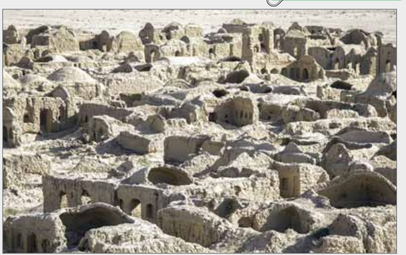
کوشک، روستای فراموش شده