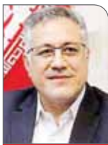
مجلس شورای اسلامی

مجلس شورای اسلامی نیز به موضوع خشک‌شدن درختان چنار خیابان ولیعصر تهران ورود کرد. طی روزهای قبل بازدید کوتاهی از درختان خشک شده خیابان ولیعصر انجام دادم. به‌نظر من علت خشک شدن می‌تواند ریختن سم و نفت و موادی نظیر اینها باشد. استفاده از همه این مواد محتمل است و مالک ملک مقابل این درختان باید حتماً پاسخگو باشد. طی روزهای آتی نیز دوباره از این درختان بازدید انجام خواهم داد. من به‌عنوان یک گیاه‌پزشک می‌گویم که شک نداریم خشک شدن همزمان ۱۰ درخت در یک محل دارای عاملی انسانی و اقدامی مخرب محیط زیست است.