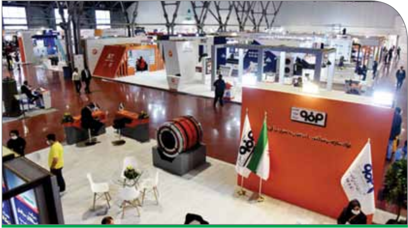
در جهان معاصر بیشترین فضاهای نمایشگاهی به کشورهای ایالات‌متحده، آلمان و چین که مهم‌ترین قطب‌های تجاری جهان به‌شمار می‌روند، تعلق دارد

این روزها زمزمه آغاز پیک جدید کرونا در کشور به گوش می‌رسد اما نکته اینجاست که باید به شرایط حاصل از شیوع ویروس کرونا به‌عنوان سبک جدید زندگی عادت کنیم. به عقیده من، صنعت نمایشگاهی از موج‌های جدید شیوع ایس و ویروس تاثیر نخواهد گرفت و به فعالیت خود ادامه خواهد داد، به‌طوری‌که از