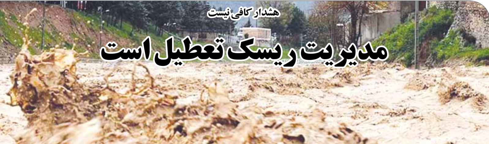
هشدار کافی نیست

وی تأکید کرد: گاهی این روان‌آب‌ها آنقدر پرسرعت هستند که ممکن است تجمع آبی در شهر شکل بگیرد یا نهرهای فرعی برای لحظه‌ای دچار انسداد شوند و این تجمع آب، سرعت را کند کند؛ اما عوامل خدمات شهری سریع در محل حاضر شده و این معایب جزئی را هم برطرف می‌کنند، بر همین اساس خوشبختانه موضوعی که شهر را دچار اختلال کند و مشکلی ایجاد شود، باتوجه به حجم بارش‌ها طی چند روز اخیر نداشته‌ایم.