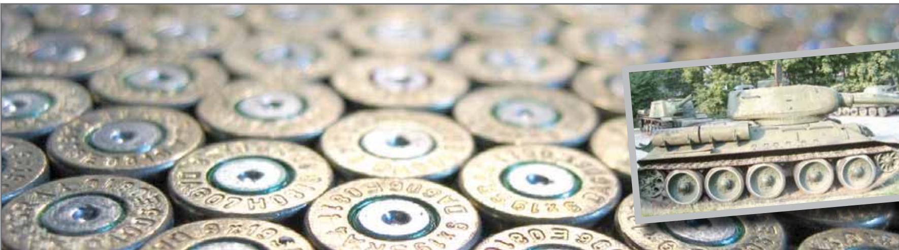
تسلیحات نظامی فعالیت پر سود قدرتمندان جهان

تقریباً نیمی از بودجه‌ای که صرف تسلیحات در جهان شده، یعنی ۴۵ درصد، متعلق به ایالات متحده آمریکا بوده است. بودجه تسلیحاتی این کشور نسبت به سال ۲۰۰۱م، سال حمله‌های تروریستی در نیویورک و واشنگتن، ۵۹ درصد افزایش داشته است. جنگ‌های آمریکا در عراق و افغانستان، همچنین پروژه این کشور برای مبارزه با تروریسم چنین هزینه‌ای را به بار آورده است. آلمان در این جدول در مکان ششم قرار دارد. بنا به این گزارش آلمان در سال گذشته ۲۳ میلیارد و ۷ میلیون یورو (۳۶/۹ میلیارد دلار) در زمینه‌های نظامی هزینه کرده است که این رقم ۳ درصد هزینه تسلیحاتی جهان را شامل می‌شود. آلمان در فاصله سال‌های ۲۰۰۳ تا ۲۰۰۷م سومین کشور بزرگ صادرکننده اسلحه بوده و ۱۰ درصد بازار تسلیحات را به خود اختصاص داده است. آمریکا با ۳۱ درصد و روسیه با ۲۵ درصد به ترتیب مقام‌های اول و دوم را بین کشورهای صادرکننده اسلحه دارند.