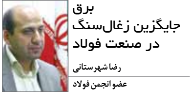
برق جایگزین زغال سنگ در صنعت فولاد