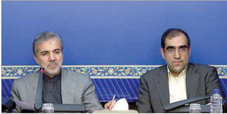
نان گفت: در سال جاری هر کیلوگرم گندم را ۱۱۵۰ تومان از کشاورزان خریدیم و ۴۶۵ تومان به نانوایان می‌فروشیم یعنی مبلغ ۶۸۵ تومان برای نان یارانه می‌پردازیم و نانوایان عزیز و زحمتکش باید با قیمت داشته باشند و ما و همه مقامات خود را برای هر شرایطی آماده کرده‌ایم.

سختگوی دولت با اشاره به کاهش قیمت جهانی نفت افزود: ما برای سال آینده ۸ برنامه پیش‌بینی کرده‌ایم که در آن قیمت نفت بین ۷۰ تا ۸۰ دلار در نظر گرفته شده است. نوبخت رشد اقتصاد کشور را در بودجه سال آینده ۲/۵ تا ۳ درصد پیش‌بینی، و برای تورم نیز بر کمتر از ۱۵ درصد تاکید کرد. وی تصریح کرد: کاهش درآمد دولت حاصل از فروش نفت به منزله کسری بودجه نخواهد بود بلکه تحقق نیافتن منابع پیش‌بینی شده تعبیر می‌شود و دولت به‌اندازه کاهش درآمد، هزینه‌های خود را کاهش خواهد داد.