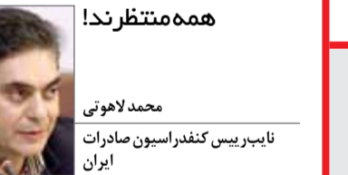
همه منتظر ند!

مهم‌تر از توافق، حفظ روابط سیاسی و اقتصادی طرفین در جهت مثبت است که باید مورد بحث و بررسی قرار گیرد. در حال حاضر اقتصاد منطقه به دلیل مشکلات متعدد از جمله حضور داعش در عراق یا درگیری‌های رژیم صهیونیستی با حماس، بهم ریخته و پایدار شدن یک شرایط مطلوب نیاز به صبر و حوصله دارد. این صبر و حوصله هم یعنی همه کشورهای منطقه و از جمله ایران از قوانین بین‌المللی تبعیت کرده و در مورد نظم جهانی با یکدیگر به توافق