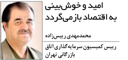
امید و خوش‌بینی به اقتصاد باز می‌گردد

کاهش پیدا کند، ورود سرمایه‌گذاران خارجی چه ایرانیان مقیم خارج که دل‌شان می‌خواهد در کشورشان فعالیت اقتصادی و سرمایه‌گذاری کنند و چه کمپانی‌های بزرگ و چندملیتی، می‌تواند از سر گرفته شود. به هر حال با توجه به جمعیت، بازار و میزان مصرفی که ما داریم، در کنار اینکه از نظر سوق‌الجیشی و شرایط ژئوفیزیکی در بهترین شرایط برای مبادلات تجاری هستیم، می‌توانیم تاثیرگذاری‌های لازم را هم برای خودمان و هم برای همسایگان داشته باشیم. ضمن اینکه بحث ورود برندهای معروف خارجی و استفاده از امکانات داخلی برای مونتاژ یا تولید محصولات با کیفیت معنا و مفهوم درستی پیدا می‌کند. همه فعالان بخش خصوصی به این امید دارند که فضای خوبی حاکم خواهد شد و به مرور همه تحریم‌های مختلف بانکی از میان برداشته شده و در نهایت به ارتقای صنعت، تولید و صادرات منجر خواهد شد.