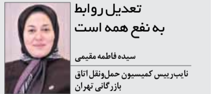
تعدیل روابط به نفع همه است

مهم‌ترین عواملی که می‌تواند بعد از لغو تحریم‌ها گره‌گشا باشد، همین رشد نظام بانکی است. به علاوه با توجه به منافع جهانی می‌توان گفت، تعدیل روابط به نفع همه است. براساس همین قضیه اگر زیرساخت‌های خوبی در جریان لغو تحریم‌ها بنا نهاده شود، می‌تواند به نفع همه کشورهایی باشد که با ایران همکاری و همراهی می‌کنند. از طرفی وقتی ابزارهای موجود آمدن ارتباط سازنده بین کشورهای مختلف ایجاد شود و داد و ستدهای مالی در حد مطلوب صورت بگیرد، آن زمان تجار با شرایط بهتری می‌توانند کالاهای خود را به بازارهای هدف تزریق کنند و این افزایش تولید و صادرات در نهایت به ارتقای کیفیت منجر خواهد شد. بنابراین تولید و توسعه حضور در بازارهای اقتصادی بیش از پیش تقویت خواهد شد.