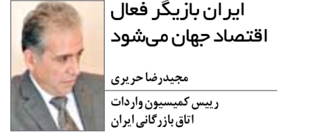
ایران بازیگر فعال اقتصاد جهان می‌شود

بپردازند. با این همه به ثمر رسیدن مذاکرات باید همراه با عزت و سرافرازی ملت ایران باشد و نتیجه به نفع آنها رقم زده شود. فعالان اقتصادی منهای تمام مسائل، معتقدند که با مثبت شدن نتیجه مذاکرات، می‌تواند اقتصاد را شکوفا کرد. در این صورت ایران می‌تواند بازبگر فعال اقتصاد جهانی باشد. در کل می‌توان گفت؛ جنگ‌های سیاسی نباید منجر به محاصره اقتصادی ملت‌ها شود. این در حالی است که در طول سال‌های گذشته، با تشدید تحریم‌ها این کار در رابطه با ایران صورت گرفت. بر همین اساس است که فعالان اقتصادی علاقه‌مندند که هرچه زودتر کنش و واکنش ایران در عرصه اقتصادی به سرانجام برسد.