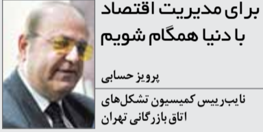
برای مدیریت اقتصاد با دنیا همگام شویم

شاید نخستین دستاورد موفقیت در مذاکرات، تاثیر مثبت روانی آن برای ایران باشد. در این صورت موج خوش‌بینی و امید در کشور افزایش یافته و در سایه آن فعالیت‌های اقتصادی رونق می‌گیرد. همین خوشبینی خروج از رکود و رسیدن به رونق نسبی را در پی خواهد داشت. مسائل روانی بر روی زندگی مردم تاثیر غیرقابل انکاری دارد. مثلا با استقرار دولت تدبیر و امید، موج اول دلگرمی‌ها به مردم رسید و آرامش نسبی در کشور برقرار شد. بازار ارز کمی آرام گرفت و رشد افسار گسیخته تورم مهار شد. نکته دیگر اینکه اگر توافقات مثبت باشد و به تدریج تحریم‌ها