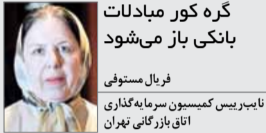
گره کور مبادلات بانکی باز می‌شود

بزرگترین مشکل فعالان اقتصادی ایران و تجار و بازرگانان، بحث انتقال پول است و همین مشکل باعث شده که هزینه‌های واردات و صادرات بالا رفته و در نهایت هزینه تمام شده کالا افزایش یابد. مهم‌ترین اتفاقی که بعد از توافق مذاکرات هسته‌ای می‌تواند بیافتد، آن است که مشکل نقل و انتقال پول حل شده و بازرگانان و تجار بتوانند برای واردات و صادرات با سهولت پرداخت‌های خود را انجام دهند. این در حالی است که در این صورت هم هزینه تمام شده واردات و صادرات کاهش می‌یابد و هم ایمنی نقل و انتقالات بالا می‌رود. در حال حاضر واردات و صادرات برخی از کالاها به دلیل تحریم‌ها با واسطه انجام می‌گیرد و با وجود واسطه‌ها و تبدلات این جنبیتی نمی‌توان امنیت و کاهش قیمت تمام شده را آنطور که باید اجرائی کرد. مهم‌ترین عامل برای حل تمام این مسائل هم حل مسئله سوئیفت است که در این صورت مشکل نقل و انتقال مالی نیز مرتفع خواهد شد. دومین مسئله هم آن است که پای سرمایه‌گذاران اروپایی به کشورمان باز میشود. به عبارت دیگر افزایش سرمایه‌گذاری خارجی دومین دستاوردی است که در حوزه اقتصاد برای ایران به ارمغان می‌آید. با جذب سرمایه‌گذاری خارجی اشتغال ایجاد شده و به حل مسئله بیکاری ایران کمک خواهد کرد. در این صورت می‌توان در ادامه، از رکود حاکم در کشور خارج شد و مشکل تورم را هم بیشتر از شرایط فعلی حل کرد.