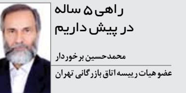
راهی ۵ ساله در پیش داریم