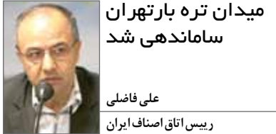
میدان تره بارتهران ساماندهی شد