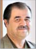
محمد مهدی رییس‌زاده رییس کمیسیون سرمایه‌گذاری اتاق تهران