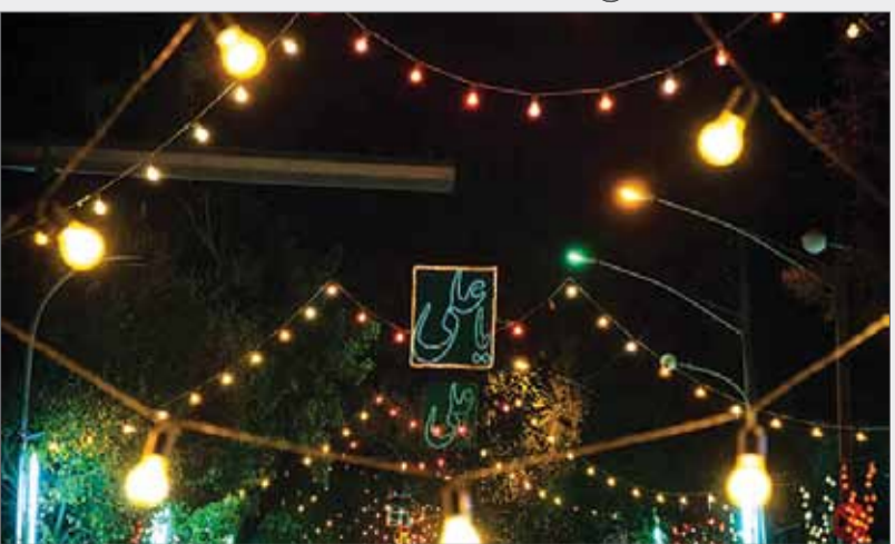
عکس - حامد ایلخان