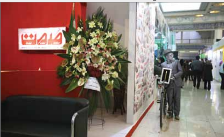
شنبه ۲۴/۱۰/۹۳ در کادر «عکس روز» روزنامه «عکس» دوچرخه‌سواری را در نمایشگاه مطبوعات و خبرگزاری‌ها نشان می‌داد. این دوچرخه متعلق به سایت IRAN FRONT PAGE بود. عکاس لحظه حضور وی را در کنار غرفه عکس: فاطمه خوشبویی شکار کرد.