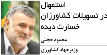
وزیر جهاد کشاورزی

حدود یک‌ماه گذشته کنفرانس دو روزه‌ای در لندن برگزار شد که در این کنفرانس شرایط ایران پس از تحریم‌ها بررسی شد ولی نماینده ای از کشورمان به‌طور رسمی در این کنفرانس حضور نداشت، که این موضوع جای تاسف دارد. تعدادی از شرکت‌های خصوصی ایرانی در این کنفرانس حضور داشتند و ورودی کنفرانس ۲۰۰۰ پوند بود، اهمیت موضوع به اندازه‌ای است که طرف‌های امریکایی و کانادایی در این کنفرانس حضور داشتند و جک استراو، وزیر سابق انگلستان نیز سخنران اصلی این مراسم بود. دیر یا زود تحریم‌ها برداشته می‌شوند اما برنامه مدونی برای بعد از تحریم‌ها نداریم و سازمان‌های مختلف باید در این زمینه برنامه‌ریزی کنند که بعد از تحریم کدام بخش باید در ابتدا فعال شوند. این در حالی است که بخش خصوصی در کنار دولت می‌تواند در این برنامه‌ریزی دولت را همراهی کند. اولویت فعال‌سازی در بخش‌های مختلف اقتصادی برای بعد از تحریم باید از حالا مشخص شود، این موضوع بسیار مهم است که بازار ایران در شرایط پس از تحریم‌ها چگونه خواهد بود و موضوع جالب این است که خارجی‌ها به این موضوع توجه می‌کنند ولی کشورمان برنامه‌ریزی مدونی در این زمینه ندارد. یکی از موارد مهمی که در رابطه با فعالیت صادرکنندگان و تسهیل شرایط برای آنها باید به آن توجه کرد بحث حذف کارت بازرگانی است که این کار هرچه سریع‌تر باید انجام شود. در واقع صادرکنندگان نباید نیاز به کارت بازرگانی داشته باشند.