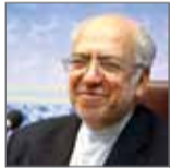
نایب‌رئیس هیئت‌مدیره اتاق بازرگانی ایران

رییس سازمان توسعه تجارت هم در گفت‌وگو با خبرنگار فارس از برقراری تعرفه ترجیحی با برخی از کشورهای خبر داد و گفت، برای رونق بازار و افزایش مشتری به دنبال برقراری تعرفه ترجیحی با کشورهای همسایه از جمله ترکیه هستیم و از ابتدای سال آینده میلادی، فهرستی از کالاهای بین ایران و ترکیه براساس تعرفه ترجیحی