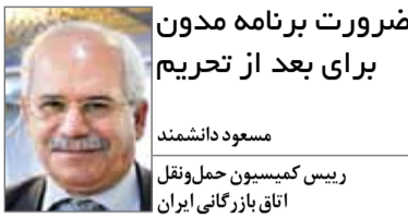
رئیس کمیسیون حمل‌ونقل اتاق بازرگانی ایران

حدود یک‌ماه گذشته کنفرانس دو روزه‌ای در لندن برگزار شد که در این کنفرانس شرایط ایران پس از تحریم‌ها بررسی شد ولی نماینده ای از کشورمان به‌طور رسمی در این کنفرانس حضور نداشت، که این موضوع جای تاسف دارد. تعدادی از شرکت‌های خصوصی ایرانی در این کنفرانس حضور داشتند و ورودی کنفرانس ۲۰۰۰ پوند بود، اهمیت موضوع به اندازه‌ای است که طرف‌های امریکایی و کانادایی در این کنفرانس حضور داشتند و جک استراو، وزیر سابق انگلستان نیز سخنران اصلی این مراسم بود. دیر یا زود تحریم‌ها برداشته می‌شوند اما برنامه مدونی برای بعد از تحریم‌ها نداریم و سازمان‌های مختلف باید در این زمینه برنامه‌ریزی کنند که بعد از تحریم کدام بخش باید در ابتدا فعال شوند. این در حالی است که بخش خصوصی در کنار دولت می‌تواند در این برنامه‌ریزی دولت را همراهی کند. اولویت فعال‌سازی در بخش‌های مختلف اقتصادی برای بعد از تحریم باید از حالا مشخص شود، این موضوع بسیار مهم است که بازار ایران در شرایط پس از تحریم‌ها چگونه خواهد بود و موضوع جالب این است که خارجی‌ها به این موضوع توجه می‌کنند ولی کشورمان برنامه‌ریزی مدونی در این زمینه ندارد. یکی از موارد مهمی که در رابطه با فعالیت صادرکنندگان و تسهیل شرایط برای آنها باید به آن توجه کرد بحث حذف کارت بازرگانی است که این کار هرچه سریع‌تر باید انجام شود. در واقع صادرکنندگان نباید نیاز به کارت بازرگانی داشته باشند.