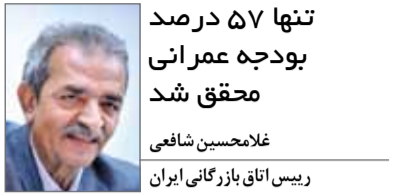
رییس اتاق بازرگانی ایران

چهل و یکمین جلسه هیات نمایندگان اتاق بازرگانی ایران دیروز با حضور جمعی از بخش خصوصی برگزار شد که با انتقاداتی از سوی رییس و اعضای اتاق بازرگانی ایران همراه بود. ضمن اینکه مانند همیشه فعالان بخش خصوصی درخواست‌ها و راهکارهای خود را نیز ارائه دادند.