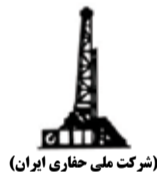
(شرکت ملی حفاری ایران)