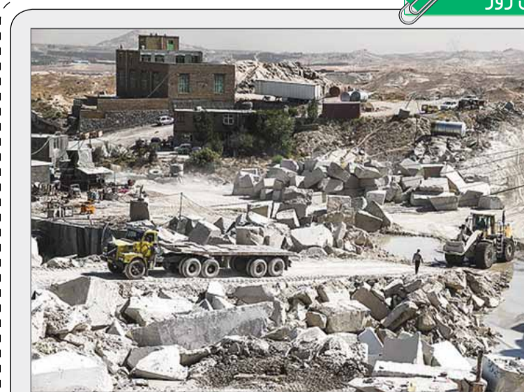
معدان سنگ گرانیت مشهد مهر سعید کلی

نشانی: تهران، خیابان قائم مقام فرانسوی، کوچه آزادگان شماره ۲۶ پستی (۱۵۸۶۷۳۳۸۱) www.smtnews.ir وب سایت: پست الکترونیکی: info@smtnews.ir روابط عمومی: PR@smtnews.ir آگهی: ads@smtnews.ir پیامک: ۳۰۰۰۸۲۱۹۰