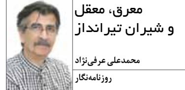
معرق، معقل و شیران تیرانداز