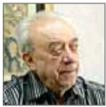
رییس اتاق بازرگانی و صنایع و معادن تهران