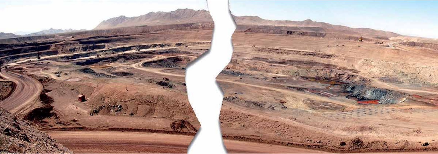
گزارش ویژه از مشکلات مالکیت معادن در استان‌ها