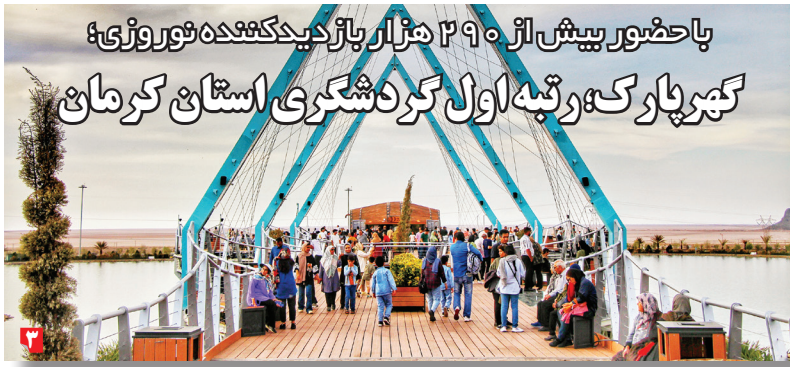
با حضور بیش از ۲۹۰ هزار بازدیدکننده نوروزی؛ کبرپارک رتبه اول گردشگری استان کرمان

۲۵ فروردین ۱۴۰۴ ۱۵ شوال ۱۴۴۶ ۱۴ آوریل ۲۰۲۵