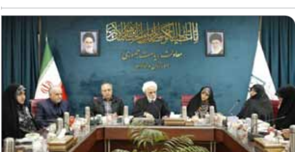
هستم تا بتوانیم قدم‌هایی را برداریم و به اجرای تفاهات نزدیک شویم.