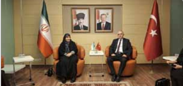
به سامانه رفاهی وزارت کار گفت: به‌دنبال ارائه تسهیلات ویژه به اقشار ضعیف و دهک‌های پایین درآمدی در بخش مسکن هستیم.

در پایان این جلسه، مقرر شد موضوع در جلسه بعدی با حضور وزرای نفت، امور اقتصادی و دارایی و صنعت، معدن و تجارت بررسی شود.